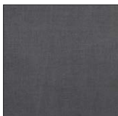
DARK GREY F032