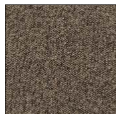
SEPIA TINT G233