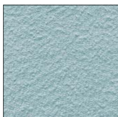
ALICE BLUE G241