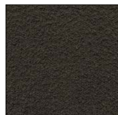
COFFEE BEAN G234