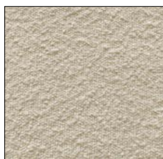
VANILLA ICE G231