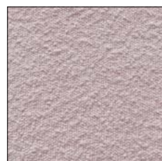
PALE PINK G243