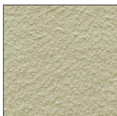
LEMON SORBET G242