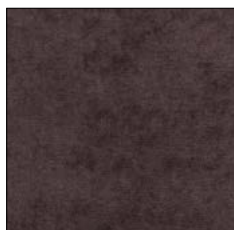
DEEP BROWN G701