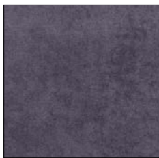
DEEP BLUE G705